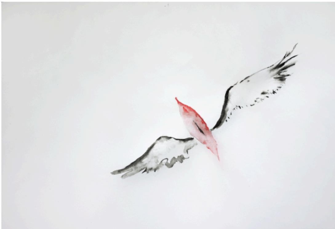
Annette Messenger, "Le vagin ailé mercredi"

Le Fonds de dotation Merci termine cette année anniversaire de ses 10 ans par une vente aux enchères d'œuvres contemporaines, offertes par 30 artistes internationaux.