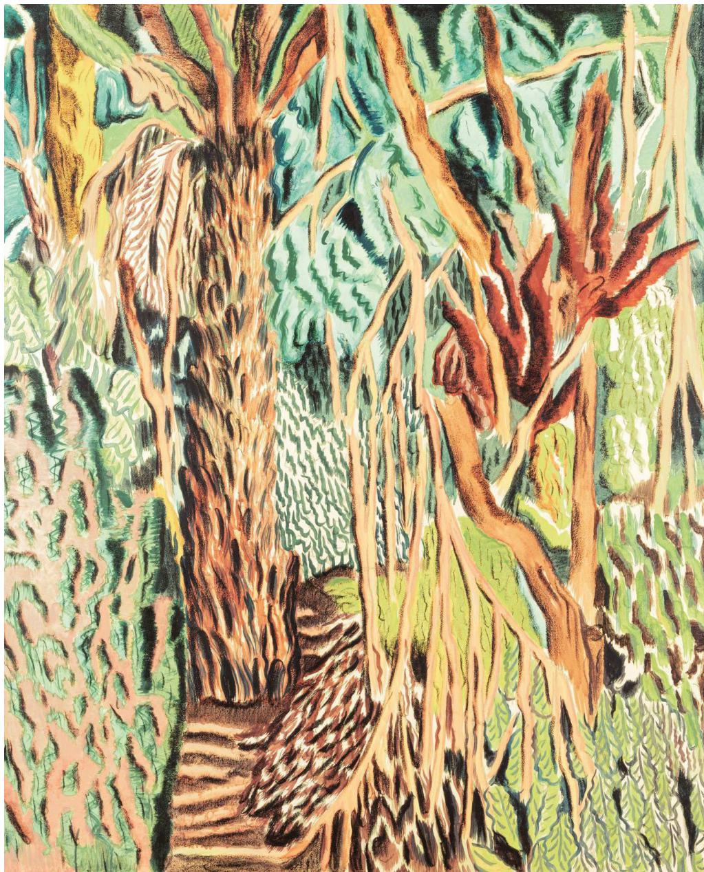
Pierre Seinturier, Centralia/001 , 2018, acrylique et pastel à l'huile sur toile, 162 x 130 cm.

Vente « Heaven » , du 13 au 18 novembre, sur le site de Sotheby's. fondsdedotationmerci.org sothebys.com/en/