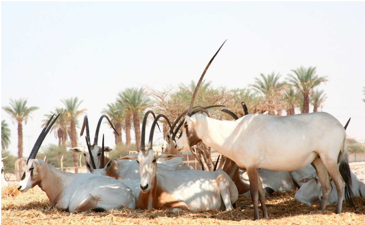
Le sanctuaire de l'oryx dans le sultanat d'Oman, inscrit en 1994 sur la liste du patrimoine mondial avant d'être retiré en 2007.