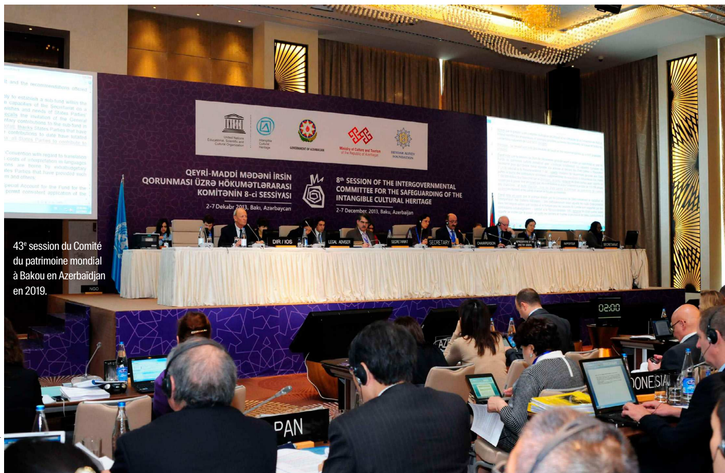
43 e session du Comité du patrimoine mondial à Bakou en Azerbaïdjan en 2019.