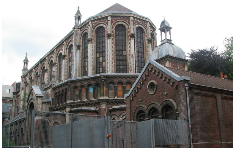
La chapelle Saint-Joseph de Lille.